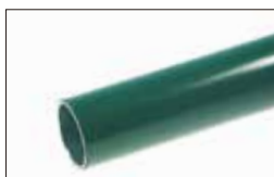
フォレストグリーン [M]