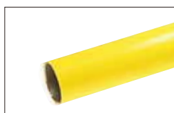
カナリヤイエロー [CY]