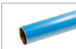
セルリアンブルー [CB]