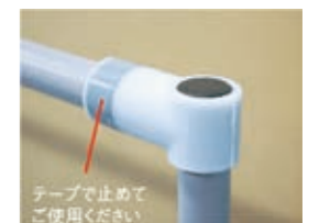
テープで止めてご使用ください