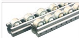
JB-500 鉄ホイールタイプ